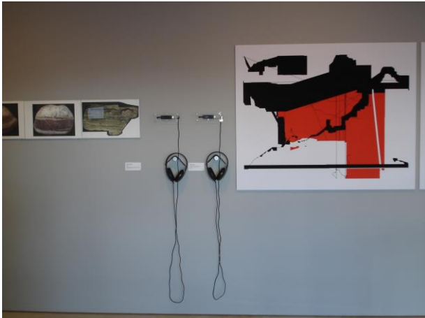
[La exposición Possibilidad de acción. La vida de la partitura , Centro de Estudios MACBA, 2008]

producir contenidos de calidad que te obliguen a volver... Cosa que ocurre a menudo, afortunadamente. Año tras año, reclamamos la necesidad de revisar el servicio que ofrecemos, pero nos topamos con la misma pared: un complejo contexto de recesión y decrecimiento constante en el que tienes que estar satisfecho por el simple hecho de existir. Y así es, estamos felices con existir y poder seguir haciendo lo que hacemos.