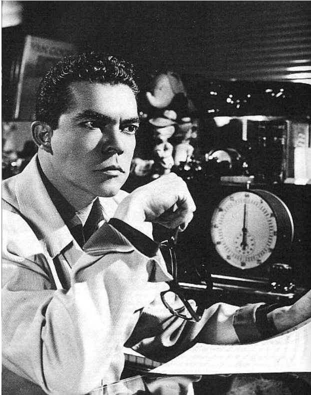
[Juan García Esquivel]