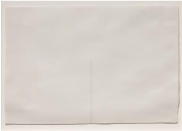
[Alfons Borrell, Sense títol , 1976]

Sense títol , 1976 Col·lecció MACBA. Consorci MACBA www.macba.cat/ca/sense-titol-3647