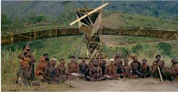
[Aeroplano construido por las sectas Cargo]