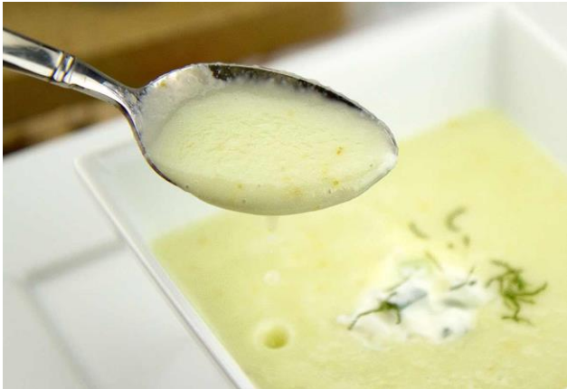
[Sopa de melón]