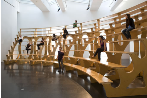
[Rita McBride Arena , 1997]