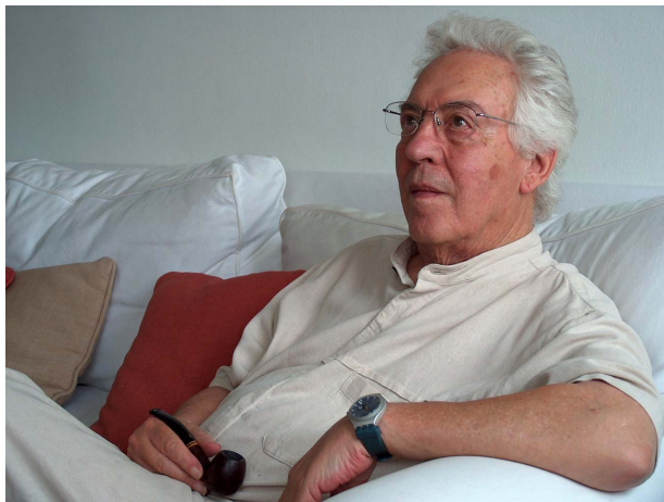
[Josep Maria Mestres Quadreny]

Nascut a Manresa l'any 1929, la personalitat i l'empenta de Mestres Quadreny va resultar cabdal a l'hora d'aportar els necessaris rajos de llum en una època d'absoluta foscor política i social. No només des del seu vessant purament compositiu, sino també com a catalitzador i dinamitzador d'un context cultural senzillament erm. La seva decisiva implicació en entitats i institucions tan rellevants com la Fundació Joan Miró, el Centre d'Estudis Catalans de la Universitat de París, el Consorci de l'Auditori i de l'Orquestra Simfònica de Barcelona, el Conjunt Català de Música Contemporània o la Fundació Phonos, serveixen d'exemple perfecte de la seva incansable tasca de difusió i regeneració constants. A tots nivells.