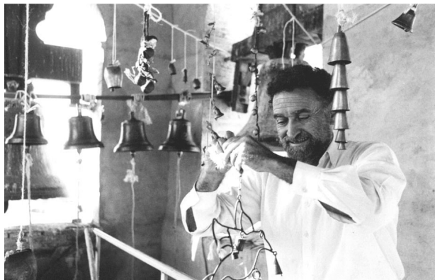
[Campanar portatriu. Fotografia: David Jiménez]

I com la resta de la seva carrera, l'aportació a la campanologia i la plurifocalitat de Barber és àmplia i variada. Des dels recitals de delicats harmònics del seu artesanal "campanar portatiu", fins als descomunals i ja incomptables concerts de ciutat, on campanars d'església, bandes de música, xiulets i canons converteixen l'espai en un auditori impossible pel qual passejar durant tota l'execució de la peça. O aquells excessos sonors coneguts com a "concerts de sol a sol", maratons sòniques en un esperit semblant als All-Night Concerts de Terry Riley als anys seixanta o els rituals de Hermann Nitsch al seu castell de Prinzendorf a Àustria. O la continuació lògica de tots ells, representada per les naumàquies: barreges de batalla i concert naval en què es fonen de nou flaixos en el subconscient individual i col·lectiu, tradició, instint i la peculiar manera de concebre i explotar el binomi entorn-so d'aquest valencià universal.