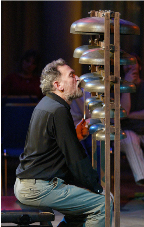
[Glockenkonzert Kaiserslautern. Fotografia: Astrid Karger © Llorenç Barber 2005]