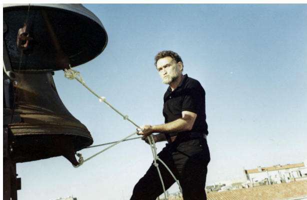
[Conciert de ciutat, Toulouse. ]