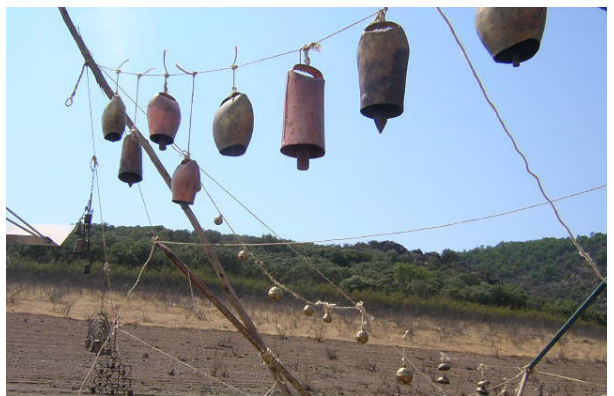
[De sol a sol. Fotografia: Montserrat Palacios. © Llorenç Barber 2005]